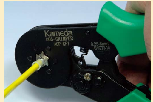
ラチェット式、強度調節付き

COSスリーブ圧縮工法は、耐震性能や省エネ効果に優れ特許を取得。(第4130931号) 日本国内で使用される挿入型機器の端末接続(国内製、海外製)にご使用頂けます。