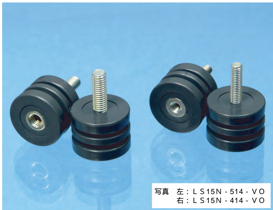
写真 左: LS-15N-514-V0 右: LS-15N-414-V0