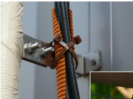
屋外の配線結束に