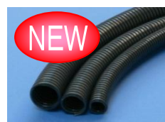
耐熱品(ナイロン製)